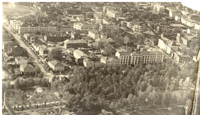
Вид Сыктывкара. 1954 год

Дом крестьянина предназначался в первую очередь для приезжавших для торговли на городском рынке колхозников, которые могли здесь переночевать, оставить на ночь лошадей и телеги. «Дать колхознику, интеллигенту села, прибывшему в город для разрешения личных или служебных вопросов в республиканские учреждения, приют, культурный отдых, проявить заботу о них – дело важное.<...>. А Дому крестьянина отвели ветхий полусгнивший домик. При нем нет чайной, буфета, кипятильника, сушилки, парикмахерской. Во всем доме – ни одного плаката, ни одного лозунга. На весь дом