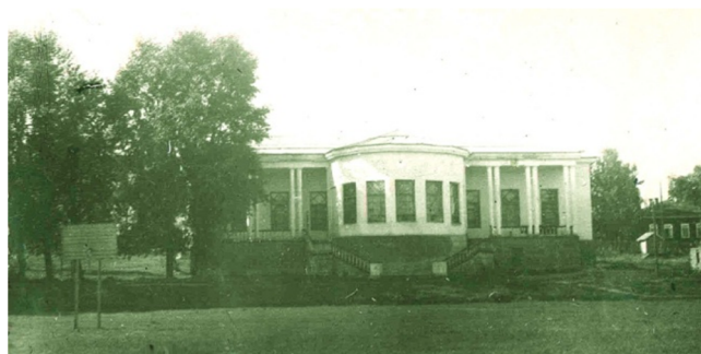
Выставочный павильон в парке им. Кирова, посвященный 25-летию Коми АССР. 1953 год

В отдельном павильоне демонстрировались достижения сельского хозяйства, были представлены свежие помидоры, огурцы, кабачки, баклажаны, дыни, зеленые тыквы и даже арбузы, выращенные в Коми АССР. На открытой площадке у павильона демонстрировались северные олени и выведенные усть-цилемскими селекционерами овцы печорской породы. Достижения советской культуры разместили в специально построенном сборно-щитовом доме. Экспонаты выставки демонстрировались также в шахматно-шашечном павильоне и летнем театре.