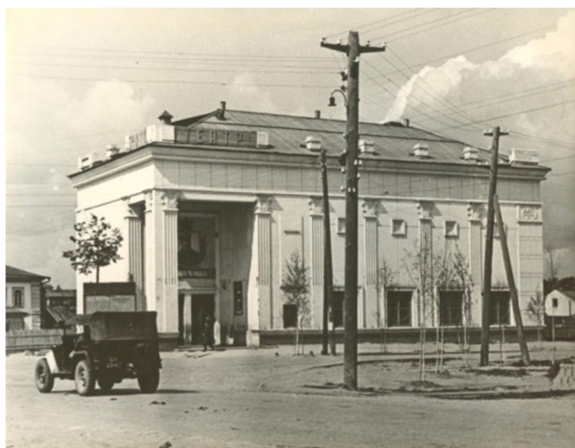
Кинотеатр «Родина». 1946 год