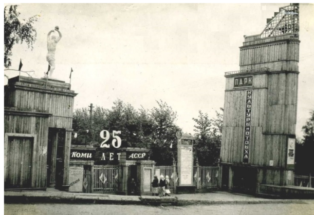
Центральный вход в парк им. Кирова. 1946 год

Парк работал сезонно. Зимний сезон начинался в конце ноября. На территории парка открывалась лыжная станция для всех желающих с возможностью обучения лыжному ходу, ледяные горки и два катка (на спортивной площадке и на льду реки Сысолы). В летний сезон (открывался в конце мая) работали аттракционы, танцплощадка, летняя эстрада и шахматный павильон. Каждый сезон сопровождался торжественным открытием. Обязательно проходил концерты коллективов художественной самодеятельности (зимой в павильоне, летом – на открытой эстраде) и спортивные соревнования. Завершение сезонов тоже отмечалось народными гуляниями.