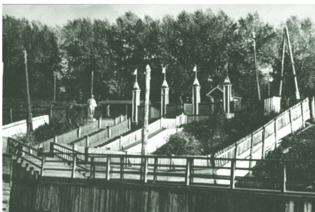
Выход в город с речного вокзала. 1962 год

Традиционным и основным видом транспорта в послевоенном Сыктывкаре был речной. В 1949 году на нем можно было добраться до пригородных поселков затона «Красный водник», Алешино, Седкыркэц, Трехозерка, Нижний Чов, сел Тентюково и Слобода и более отдаленных населенных пунктов Озёл, Зеленец и Усть-Пожег. В первые четыре поселка, находившиеся за рекой, из города только речным транспортом и можно было добраться (зимой наводились ледовые переправы). Рейсы от пристани «Сыктывкар» совершались три раза в день.