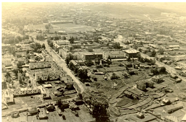
Вид Сыктывкара. 1946 год