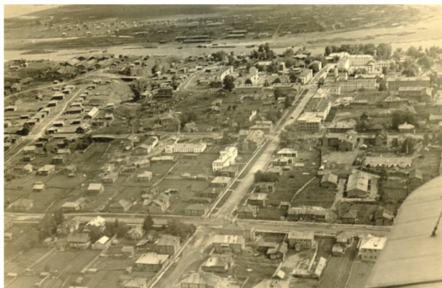
Вид Сыктывкара. 1946 год

В городе работали и другие библиотеки – при предприятиях и организациях, школах и т.д. Некоторые из них были довольно крупными. Например, в библиотеке Вычегодской судовой в 1952 году имелось пять тысяч книг, выписывалось 20 газет и журналов. Библиотекой пользовались сотни рабочих судовой и членов их семей. В библиотеке Дома отдыха Лемъю в 1953 году насчитывалось свыше тысячи книг. Большое количество различных книг, особенно общественно-политического содержания, находилось в библиотеке Сыктывкарского горкома КПСС, которая вела активную пропагандистскую работу. Здесь проходили занятия вечерней партийной школы, совещания агитаторов и пропагандистов, читались лекции для населения.