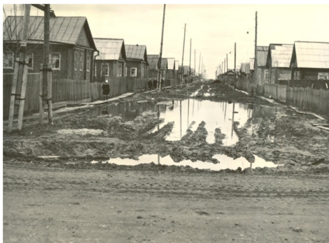
Улица Красных партизан. 1950-е годы

Над благоустройством и озеленением города работали едва ли не все сыктывкарцы – рабочие и служащие, студенты и школьники... Горисполком определял для каждого предприятия, учреждений и организации улицы, которые эти коллективы должны были благоустроить. Работы по уборке проводились в первую очередь на Юбилейной площади, улицах Советской, Бабушкина и Кирова, а также в парке им. Кирова. В рабочих поселках очистку дворов, улиц и посадку деревьев осуществляли владельцы индивидуальных домов.