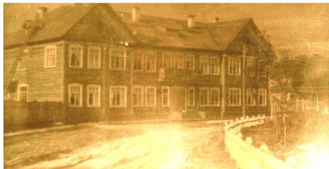
Горздравотдел на Юбилейной площади. 1950-е годы

К концу 1940-х годов в поселке сплавщиков Слободского рейда были построены участковая больница (на 25 коек), в новом поселке лесозавода – поликлиника и больница. Появились поликлиники в Красном Затоне, Верхней Максаковке, Нижнем Чове. В 1950 году действовали фельдшерско-акушерские пункты в Кочпоне, Чите, Тентюково, медкабинеты – в Заречье, Дальнем, Строителе-1, Строителе-2 и другие.