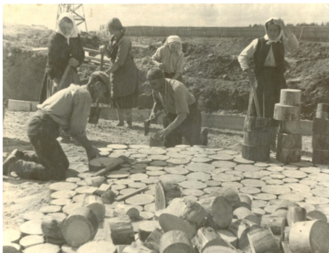
Мощение Первомайской улицы деревянными торцевыми шашками. 1946 год

Сессия горсовета приняла план благоустройства на 1955 год, в котором было указано на «необходимость навести порядок в городе и в рабочих поселках, расширить дорожное строительство и активнее вовлекать общественность в проведение работ по благоустройству дворовых территорий». Горисполком принял решение, запрещающее: ездить на тракторах по мощеным улицам; выпускать коз, коров, собак и лошадей на улицы; сваливать мусор, нечистоты и помои в овраги, канавы и на дорогу; складывать дрова, бревна, доски на улицах и в проездах; ездить по тротуарам на всех видах транспорта. За нарушение постановления виновные подвергались административному наказанию и полностью возмещали ущерб, за устранение беспорядка. С