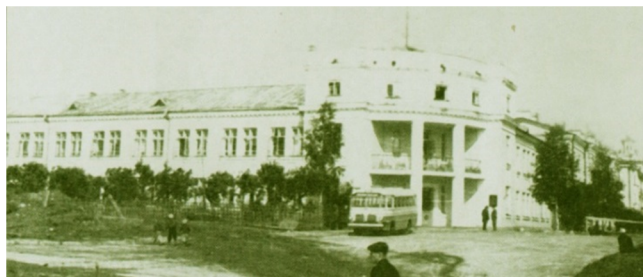
Коми филиал АН СССР

В 1949 году база была преобразована в Коми филиал Академии наук СССР. В секторах геологии, климатологии, зоологии, почвоведения, лесного хозяйства, сельскохозяйственной экономики и биологии, секторе языка, письменности, литературы и истории, промышленно-экономическом секторе и других подразделениях филиала работали 96 человек, в том числе 60 научных работников (26 из них имели ученые степени