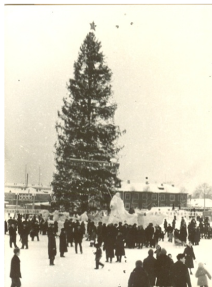
Новогодняя елка на Юбилейной площади. 1950 год

Местом проведения первомайских демонстраций в первой половине 1950-х годов была улица Кирова. Поэтому колонны собирались на улицах Советской, Бабушкина и