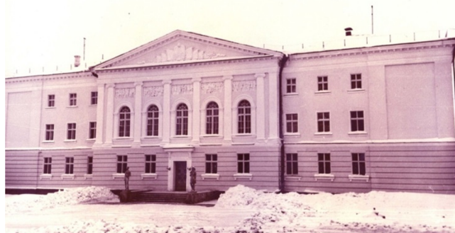
Дворец пионеров. 1956 год

Смена на городских детских площадках проходила почти так же, как и пионерских лагерях. Только к окончанию дня ребята расходились по домам. В 1952 году в Сыктывкаре было открыто девять площадок. В 1950-х годах на площадках проводился сбор металлолома и макулатуры, работа на отведенных участках пригородных колхозов. Дети посещали городские кинотеатры, Дворец пионеров, детскую библиотеку. Кроме того, было организовано более 20 сводных пионерских отрядов при детских комнатах.