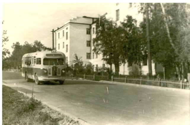
Автобус на Советской улице