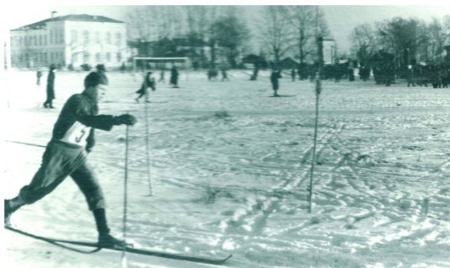
Лыжные соревнования на Юбилейной площади