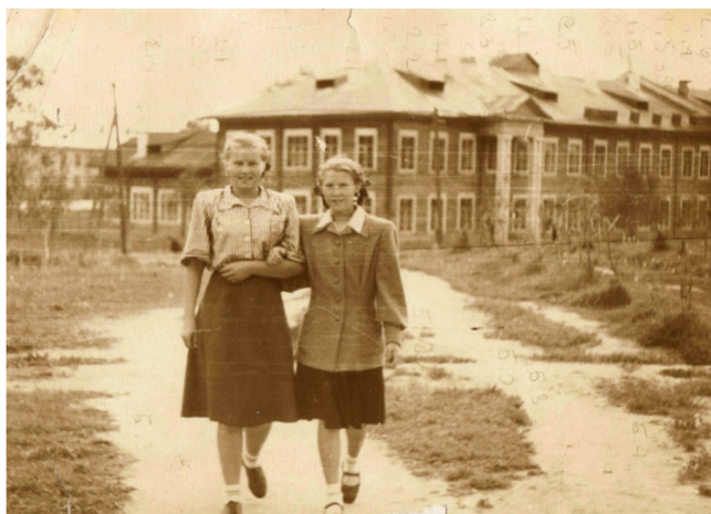
Сельхозтехникум на Юбилейной площади. 1950-е годы