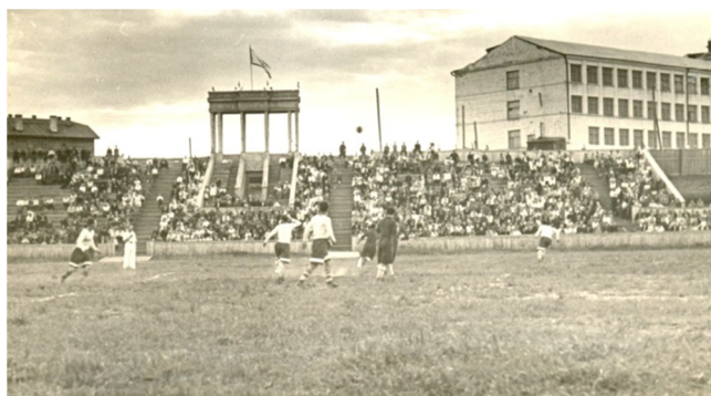
Футбольный матч на стадионе. 1946 год

В сезоне 1948 года сыктывкарская команда «Большевик» впервые стала чемпионом Коми АССР. Два года спустя первенство республики выиграло сыктывкарское «Динамо». Больше такого успеха в 1950-е годы футболистам Сыктывкара добиться не удалось. Однако победы в чемпионатах заметно подняли интерес к футболу среди горожан. В 1949 году при ДЮСШ организовали отделение детского и юношеского футбола. С 1950 года ежегодно проходило первенство города по футболу. Так, в июне 1952 года турнир футболистов Сыктывкара проходил на городской площади. 11 команд оспаривали первенство города. Перед соревнованием состоялась эстафета футболистов. Матчи наблюдали более 500 зрителей. Первенство города и переходящий приз городского комитета по делам физкультуры и спорта завоевала команда «Динамо-1».