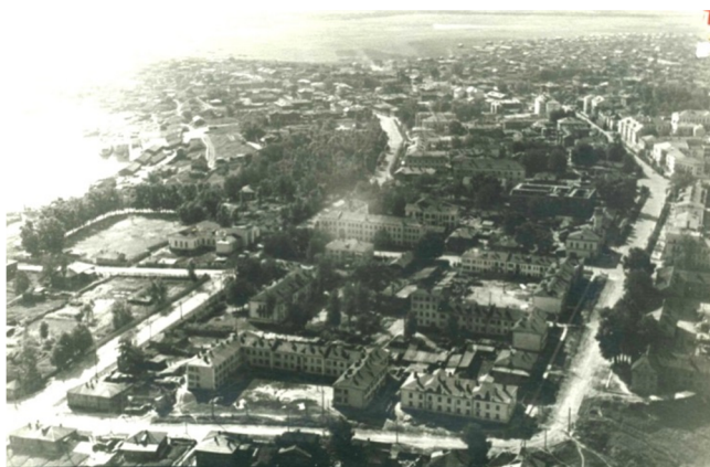
Вид Сыктывкара. 1954 год