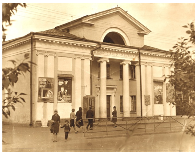
Кинотеатр «Октябрь». 1964 год

В 1953 году был построен второй кинотеатр «Октябрь», рассчитанный на 360 мест. Предполагалось, что оно войдет в строй к очередной годовщине Октябрьской революции (потому и название выбрали соответствующее). «Кроме хорошо оформленного зрительного зала, здесь будут помещения для настольных игр, небольшая читальня, буфет. Оригинальное освещение придаст кинотеатру особый уют и красоту» , – обещала зрителям газета «За новый Север» в апреле 1953 года. Но кинотеатр был открыт только в январе 1954 года. Здание было типовым, построенным в стиле сталинского классицизма (в 1950-х годах в разных городах страны было построено около ста подобных кинотеатров).