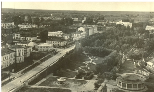
Вид Сыктывкара. 1946 год

Коми республиканский художественный музей также активно работал с первых послевоенных месяцев, тесно сотрудничая с деятелями культуры и искусства. Летом 1945 года состоялась тематическая художественная выставка «Коми народ в Великой Отечественной войне». В музее была собрана коллекция картин и скульптур, значительную часть которой пришлось хранить в других местах. В январе 1947 года музею передали один из находившихся в парке им. Кирова деревянных выставочных павильонов, а 7 ноября посетители могли познакомиться с