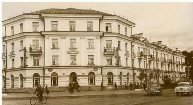
Магазин № 50

О новом гастрономе газета «Красное знамя» с гордостью писала: «В центре Сыктывкара открыт новый бакалейно-гастрономический магазин № 50. <...> По внешнему виду магазин превосходит все другие в городе. Стены зала отделаны метлахской плиткой, в ней мягко отражается электрический свет, льющийся из хрустальных абажуров, ламп дневного освещения. ...В специальных помещениях производится расфасовка многих товаров, почти на каждые два отдела имеется касса» . Работал магазин до 22 часов.