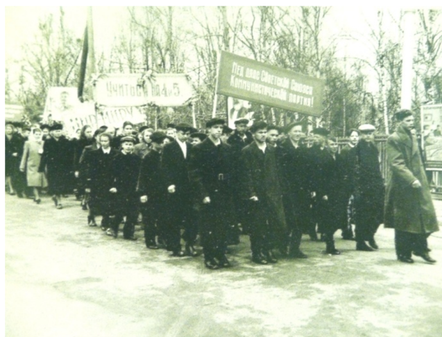
Демонстрация на ул. Кирова в Сыктывкаре