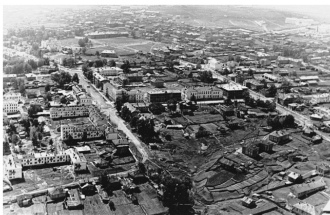
Вид Сыктывкара. 1946 год

Ежегодно 19 мая отмечался День рождения Всесоюзной пионерской организации имени В.И.Ленина. К празднику в школах подводились итоги работы пионерских дружин. От Дворца пионеров к памятнику В.И. Ленина (сначала это был памятник в парке им. Кирова, потом – на Юбилейной площади) «под знаменами пионерских дружин в такт бодрящей музыке маршей, сменяемой звуками горна и дробью барабана» направлялись пионерские дружины городских школ. У памятника выставлялся почетный караул из лучших пионеров города. Председатель городского пионерского штаба