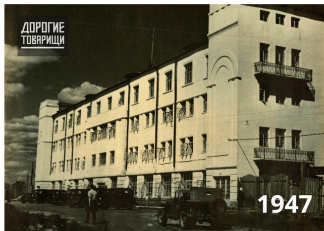
Здание Совета министров и Президиума Верховного Совета Коми АССР. 1947 год

В апреле 1948 года состоялась первая после войны городская партийная конференция, на которой горком ВКП(б) отчитывался о работе. Мирное время требовало изменения форм и