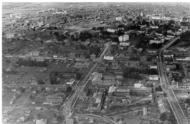
Вид Сыктывкара. 1946 год

Общественно-политическая система Сыктывкара, сложившаяся в 1930-х годах, не претерпела никаких изменений. Формально высшим органом советской власти являлся городской совет и его исполком. Выборы в городские и районные советы проходили чрезвычайно эмоционально, нередко превращаясь в своеобразные народные праздники. В выборах принимало участие до 99% избирателей и это при том, что на один депутатский мандат претендовал при строгом партийном отборе один кандидат. Выборы проводились регулярно, но были полностью формальными.