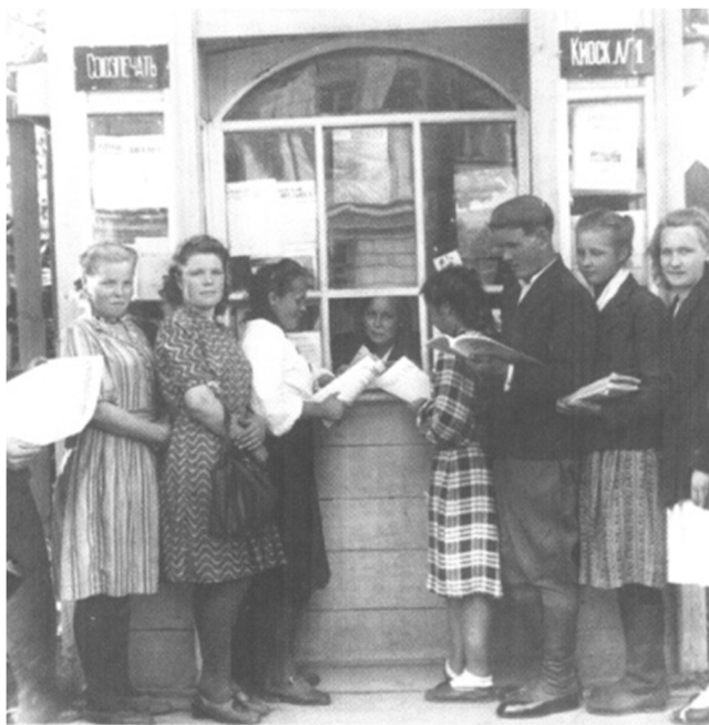
У киоска «Союзпечати». 1949 год

Средства массовой информации были неотъемлемой частью жизни сыктывкарцев. Для многих было привычным читать газеты и журналы – как местные, так и центральные, которые, с 1946 года стали доставляться в Сыктывкар на самолетах уже в день выхода. О местной жизни горожане узнавали из республиканских газет «За новый Север» и «Вөрлэдзысь» («Лесоруб»). В первый же послевоенный год появился ежемесячный республиканский литературно-художественный и общественно-политический журнал «Войвыв кодзув» («Северная звезда»). В начале 1955 года вышли последние номера газет «За новый Север» и «Вөрлэдзысь». Вместо них стала издаваться газета «Красное знамя». Ее первый номер вышел 18 марта 1955 года. Первоначально «Красное знамя» издавалась на русском и коми языках. 1 августа 1956 года вышел первый номер комизычной газеты «Коми колхозник», и с августа 1956 года «Красное знамя» стало издаваться только на русском языке. В августе 1957 года сыктывкарцы держали в руках новый ежемесячный сатирический журнал на коми языке «Чушканзі» («Оса»), который приобрел большую популярность.