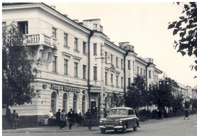
Кафе-ресторан на Советской улице. 1950-е годы

Ресторанов в Сыктывкаре в 1946 году было два: «Парма» на улице Ленина (сейчас на этом месте стоит построенное в 1975 году здание проектного института «Комигражданпроект») и «Гостиница» в гостинице «Север» на Советской улице. В 1948 году был открыт ресторан «Октябрь», расположенный около парка им. Кирова. Днем эти заведения общепита работали как столовые (но с ресторанными ценами), а в вечером как рестораны (до 24 часов ночи). К 1950 году появился ресторан на речном вокзале.