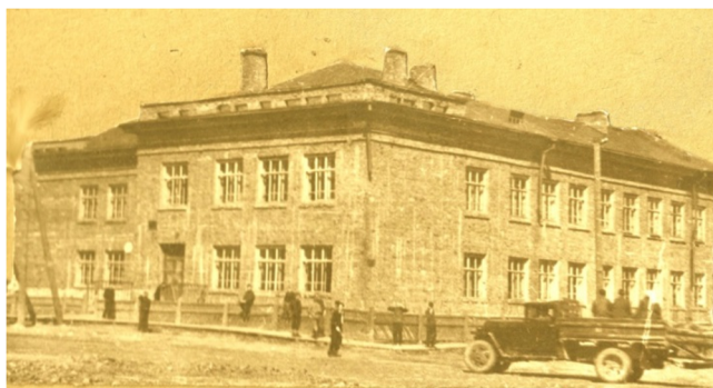
Школа № 12. 1949 год

В том же году началось строительство двух новых школ на улицах Карла Маркса (где сегодня размещается Лицей народной дипломатии) и Южной. На следующий год в городе имелось 24 школы, в которых работало 400 учителей. В 1955/1956 учебном году в школах впервые были введены уроки труда в 1–4 классах. В 1956 году в 29 школах обучалось восемь с половиной тысяч школьников. С 1 сентября этого года отменили плату за обучение в старших классах средних школ, в средних специальных и высших учебных заведениях. Все