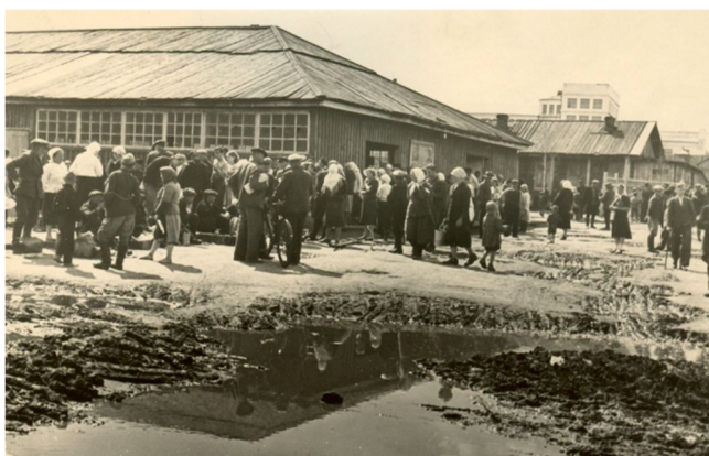
Колхозный рынок. 1946 год

Торговали на рынке пригородные колхозы (а так же колхозы из соседних областей) и частники. Рынок являлся одним из основных источников пополнения продовольственных запасов горожан. Здесь можно было купить свежий картофель, помидоры, лук, зелень, соленую рыбу, свежее мясо, яйца, кроликов, цыплят и другие сельскохозяйственные продукты. Только за один месяц на рынке продавалось не менее 50 тыс. килограммов овощей, около 35 тыс. литров молока, 2.500 килограммов меду. Могли бы продавать и больше, но мешала неблагоустроен-