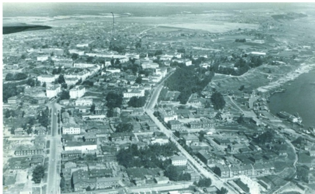
Вид Сыктывкара. 1954 год

В 1957 году был составлен второй генеральный план застройки Сыктывкара. По этому плану главными улицами города становились улица Ленина и Коммунистическая. Улица Ленина продлевалась до Лесозавода, а Коммунистическая улица – до площади у железнодорожного вокзала. В месте их пересечения оформлялся архитектурный ансамбль Юбилейной площади с многоэтажными административными зданиями. От улицы Первомайская и до улицы Мичурина планировался Спортивный городок.