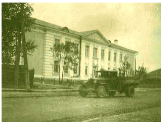
Школа № 21