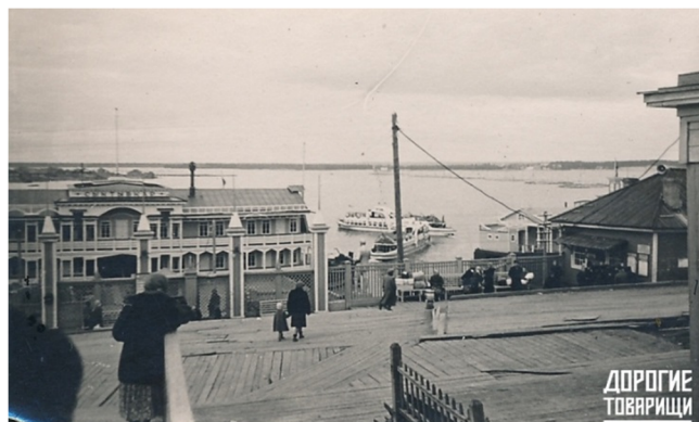
Речной вокзал. 1960-е годы