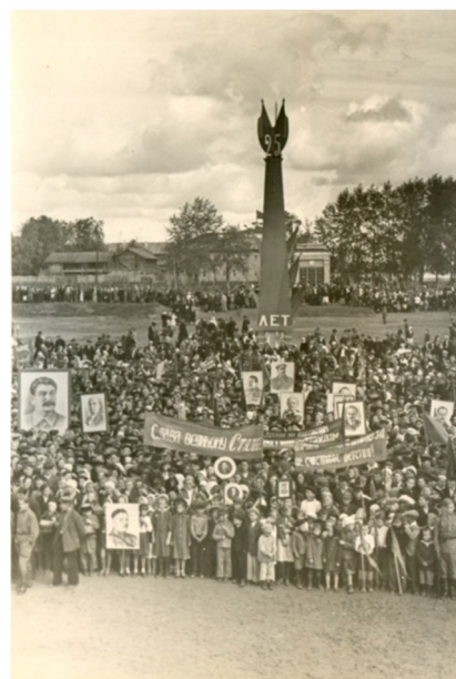
Торжества, посвященные 25-летию Коми АССР на Юбилейной площади. 22 августа 1946 года

На всех предприятиях, в учреждениях и организациях города состоялись собрания, посвященные юбилею. На них трудовые коллективы принимали обязательства по перевыполнению производственных планов. В мае – июле по обращению студентов Сыктывкарского кооперативного техникума началось благоустройство и озеленение города. Методом народных строек предполагалось «...сделать Сыктывкар городом-садом, когда каждая улица, каждый дом, каждый двор будут радовать взор». 4 августа газета «За новый Север» информировала, что «к 1 августа в городе сделано 2.036 кв. метров новых тротуаров, посажено 2270 деревьев, построено 160 погонных метров новых заборов, 1275 кв. метров новых палисадников. Открыто 9 скверов. Произведен ремонт 2228 кв. метров торцовых мостовых, отремонтировано 650 кв. метров лежневых дорог, 1500 кв. метров грунтовых, замощено 1745 кв. метров улиц. На Красной площади сделана планировка и начато строительство трибуны, ночного освещения и фонтанов, готовится фундамент для скульптуры товарища Сталина. В парке культуры построены две танцевальные площадки, отремонтирован шахматный павильон, летняя эстрада, ресторан, летний театр. Ремонтируется детский парк. На пристани произведен ремонт вокзала и подъезда к нему».