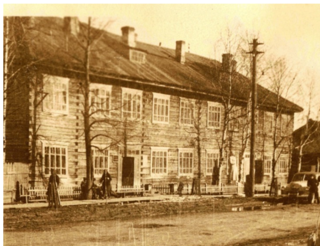
Городская автостанция. Памятник И.В.Сталину

пополнился новыми машинами. Увеличилось число автобусов на маршрутах, количество автобусных остановок в черте города. Автобусы в Лесозавод, Тентюково и Выльгорт стали ходить с 7 часов утра до 21 часов вечера. В 1950 году городской автобусный парк пополнился семью новыми автобусами, в том числе двумя новыми автобусами ЗИС-154. Во второй половине 1950-х годов автобусы ходили от автостанции до Лесозавода, Мясокомбината, п. Дальний, Больничного городка, Дырносского кирпичного завода, Тентюково, Верхнего и Нижнего Чова, Слободского рейда, Выльгорта. В декабре 1949 года на улицах Сыктывкара появились пять легковых такси. «Красивые и удобные автомашины «Победа» быстро завоевали признание трудящихся. Они связывают Сыктывкар с пригородами, курсируют между Княжпогостом и