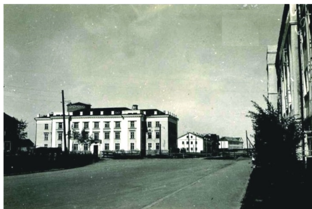
Лесная школа. 1953 год

В Сыктывкарской сельскохозяйственной школ в Нижнем Чове готовили председателей колхозов, их заместителей, счетоводов и бригадиров. Зачисление в школу проводилось без экзаменов, по рекомендации колхоза. Для первых трех категорий обучавшихся необходимо было иметь не менее чем семилетнее образование. В 1956 году школа была объединена с Сыктывкарским сельхозтехникумом.